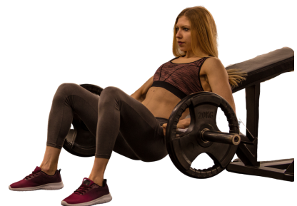
TABLA DE EJERCICIOS