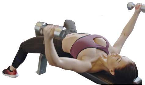
TABLA DE EJERCICIOS